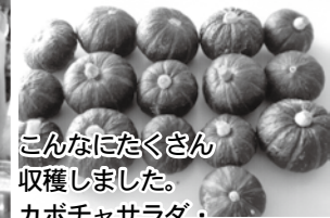
こんなにたくさん収穫しました。 カボチャサラダ・カボチャタルトを作りました。 甘くてとってもおいしかったです。

育てて欲しい子ども像は、 *明るく元気な子 *よく考えて行動する子 *人と協力しあう思いやりのある子 として、教育(保育)を展開していきます。