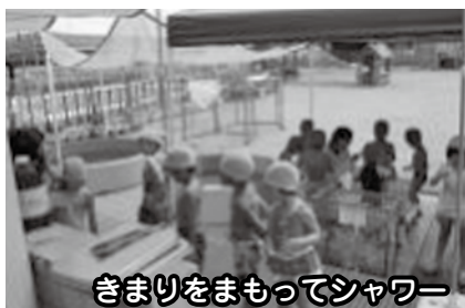
きまりをまもってシャワー