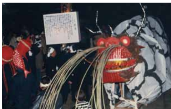
昭和63年の『雨乞い蛇』より