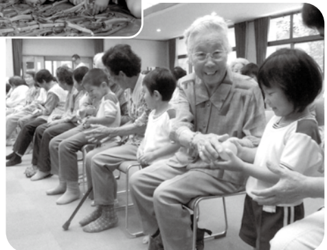
デイサービス利用者さんとの交流「ボール送りゲーム」