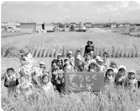
みんなで植えた稲がこんなに実りました。 みんなで稲刈りをがんばりました！

☆ 保護者の皆さんの子育てに、園も一緒に関わらせていただきます。子育て相談や育児講座の企画を随時行っています。保育時間も土曜日も含めて朝7時から夜7時頃までお預かりできる体制を整えています。