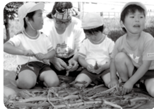
地域のおばあちゃんからいただいたそら豆をむいています。

延長保育・一時預かり保育事業・育児相談などたくさんの方の利用をお待ちしています。