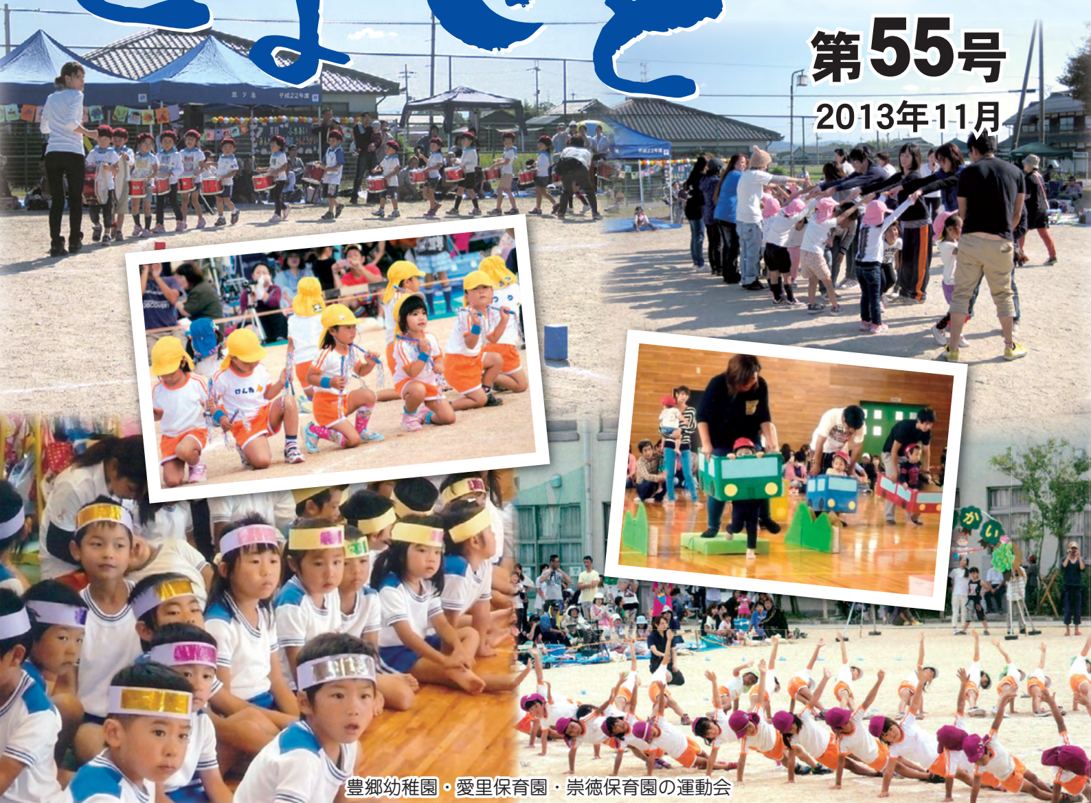
豊郷幼稚園・愛里保育園・崇徳保育園の運動会