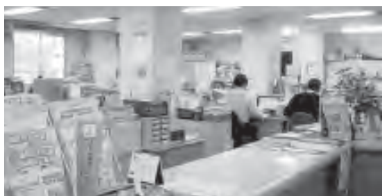
庁舎、カウンター（福祉）

議会の答弁では「福祉等の関係機関の代表の方、8団体9名から2回、意見交換会を開き、ご意見を伺った」との事だった。）