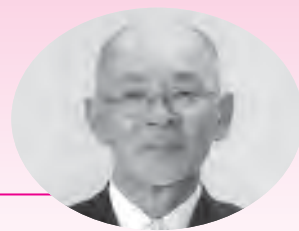
西山 勝 議員