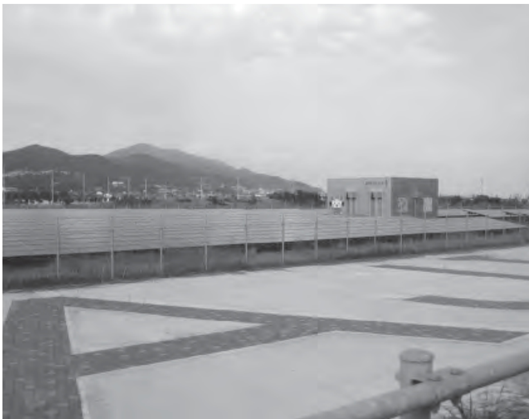
あわじ メガソーラー