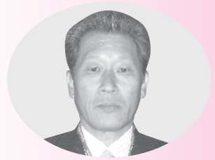
西澤 博一 議員