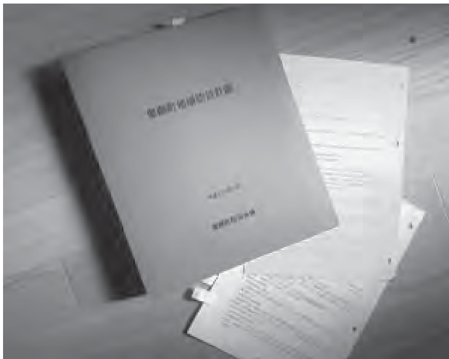
豊郷町地域防災計画

指摘のとおり、町が発行 します計画書なり、書類 等につきましては、チェ ック体制に十分な注意を 行いまして、発行なり作 成をしております。