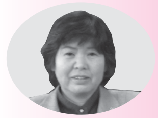
今村 恵美子 議員