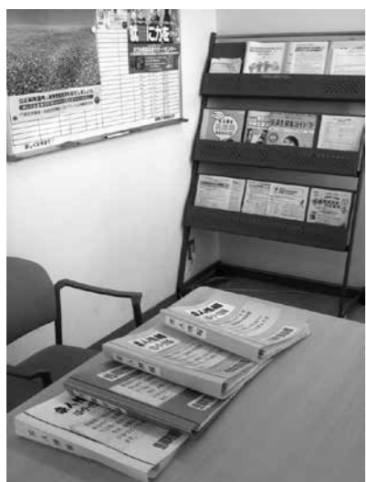
隣保館の求人コーナー

教育長 現在給食費の300円の助成と第3子の保育料の無料化を実施していて、他については、今のところ考えていません。