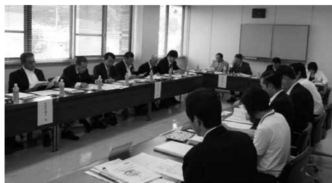
ときがわ町役場にて

次に「スタディー・オン・サタデー事業」では、児童の学力向上を願い、年間9回の土曜日に小学1年生から3年生を対象に学習ボランティアが指導す