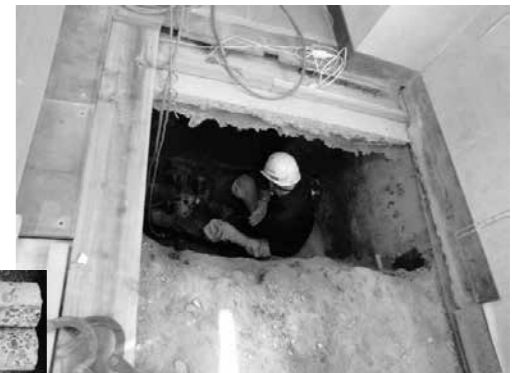
基礎調査の様子(コア抜き)