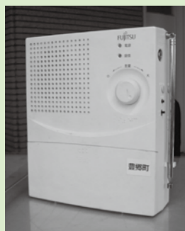
現在の防災行政無線