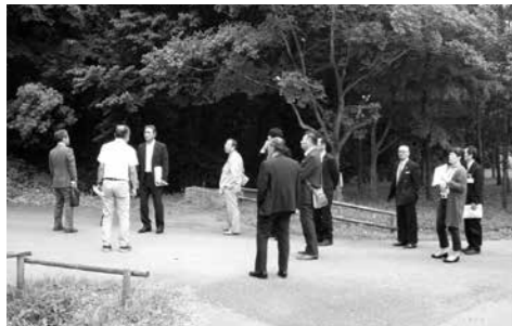
宮代町 新しい村にて

「生産法人部門」は、苗の製造・田植えなどの農作業受託、農地の借入による作付けを行っており、平成27年度販売額は4,470万円です。