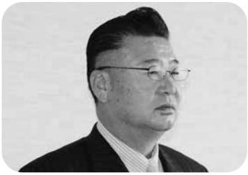
北川 かずとし 議員

間連携、政策連携を含んだ計画が不十分であったためポイントが低かったことが不採択の理由と分析しています。2次募集にかけたいと考えております。