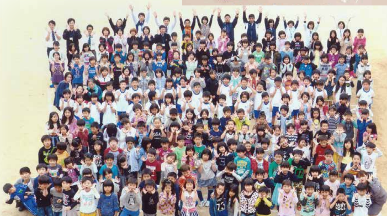
日栄小学校の児童たち