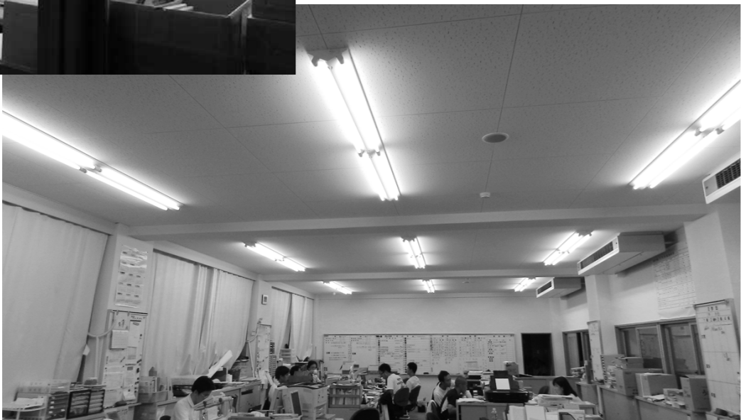
夜の中学校の職員室