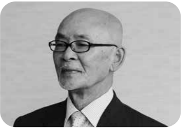
西山 勝 議員