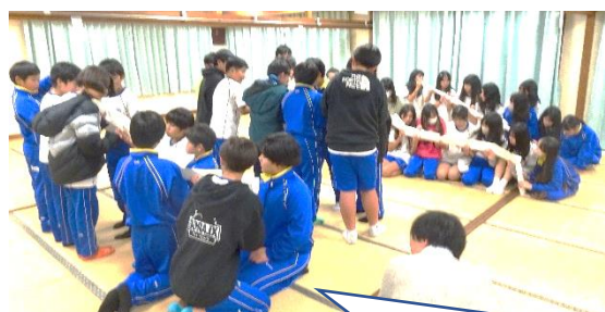
各クラス男女別で PA(プロジェクトアドベンチャー)を行いました。苦戦しながらも、意見を出し合って盛り上がりしました。

キッザニア甲子園での職業体験。予約までの待ち時間も、有効に使うと考えて行動している様子でした。