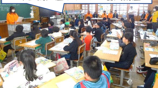
3年親子活動個性豊かなリースが完成