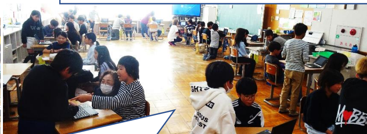
フローティングスクールの学びを5年生が4年生に発表中。