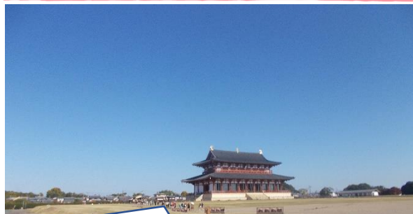
雲一つない好天に恵まれました。(平城宮跡)