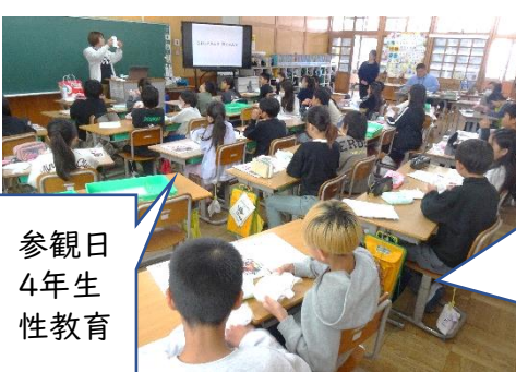
参観日 4年生 性教育

小さなオムツに自身の成長を感じました。生理用品を手にした男子は、「みたことある!」と呟きました。