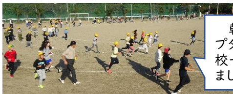
朝のステップタイムに、全校一斉に走りました。