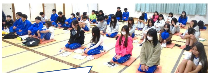
大仏館での黙想。見学時や食事などのマナーやルールを守ることができたのかを振り返りました。各先生方からの話を聞いた後の行動が、大変素晴らしかったです。