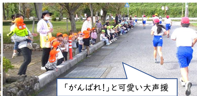
「がんばれ!」と可愛い大声援