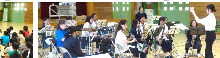
豊日中学校吹奏楽部の演奏会を開催。日栄小学校教職員とのセッションをした曲「日本昔ばなしセレクション」などを披露しました。