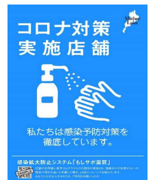
感染予防対策実施宣言書