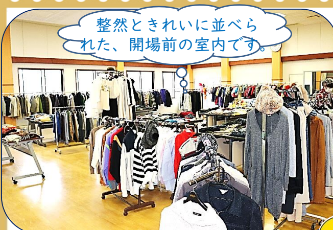
整然ときれいに並べられた、開場前の室内です。