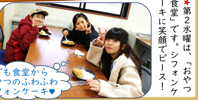
子ども食堂からおやつふわふわシフォンケーキ♡