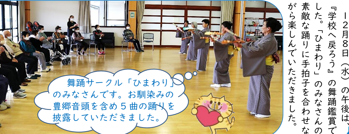
舞踊サークル「ひまわり」のみなさんです。お馴染みの豊郷音頭を含め5曲の踊りを披露していただきました。

12月8日(水)の午後は、『学校へ戻ろう』の舞踊鑑賞でした。「ひまわり」のみなさんの素敵な踊りに拍手を合わせたから楽しんでいただきました。