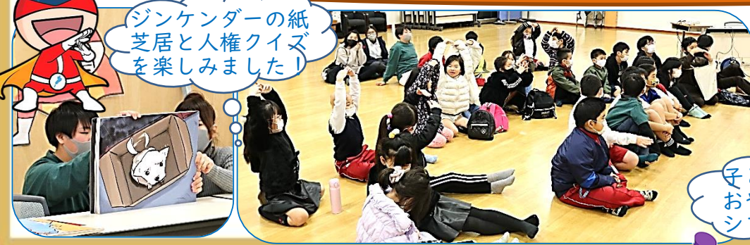
ジンケンダーの紙芝居と人権クイズを楽しみました！