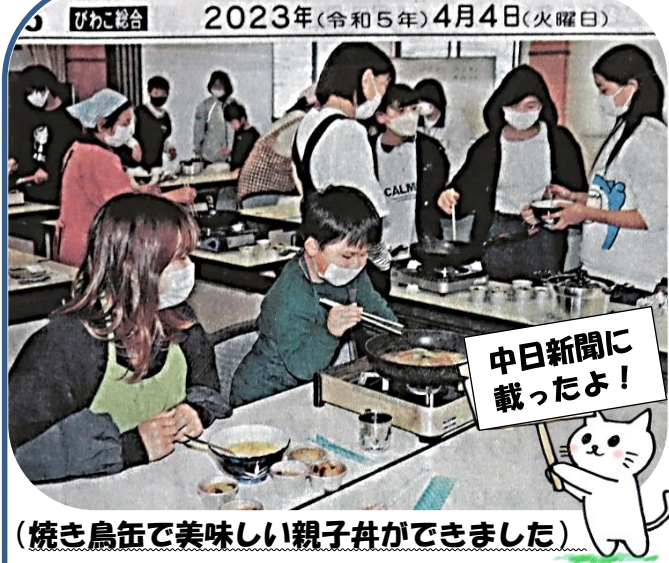
（焼き鳥で美味しい親子丼ができました）

3月29日（水）午前1時から14時まで、小中学生と保護者のみなさんを対象に「防災体験教室」を開きました。コロナ禍であったため、3年ぶりの開催となった今回、大阪ガスネットワークに依頼をし、2名のスタッフから新聞紙などを使って食器やスリッパの作り方を教えてもらいました。小中学生と保護者、そして、子ども食堂のみなさん、約30名が参加、水を使わずにおいしくできるとお菓子や焼き鳥の缶詰で作る親子丼など、真剣に調理している子どもたちの表情が印象的でした。また、地震などの災害が起きたときに困らないように自分でできることを工夫して準備しておくことが大事ですよ、という話にもうなずきながら聞いてくれました。