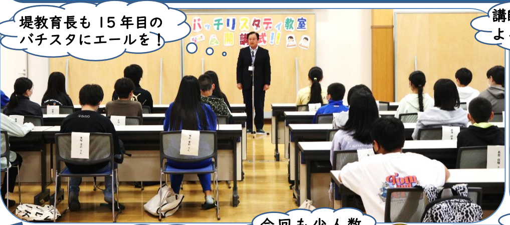
堤教育長も15年目のバチスタにエールを！