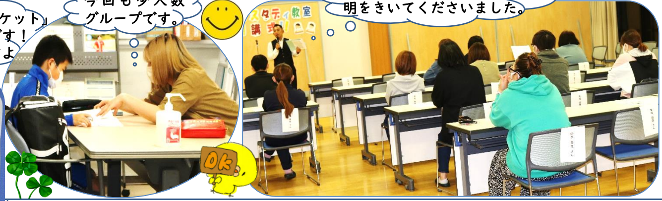
今回も少人数グループです。