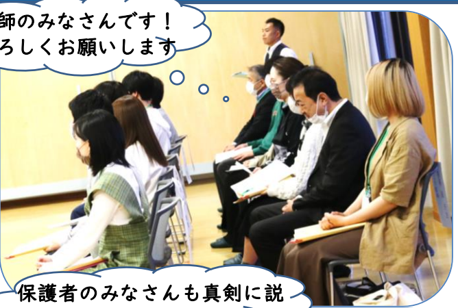
講師のみなさんです！ よろしくお願いします