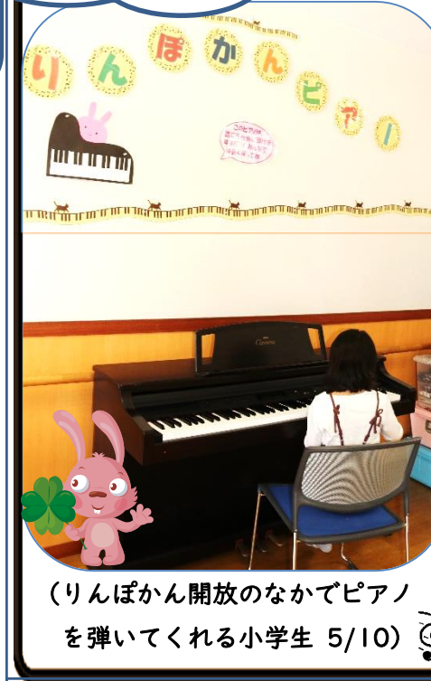
(りんぽかん開放のなかでピアノを弾いてくれる小学生 5/10)

5月9日(火)、10日(水)の両日、午後6時30分から、「バッチリスタディ教室」開講式を行いました。2009年からスタートした「バチスタ」は、今年度で15年目に入ります。昨年度よりも大幅に参加数が増加、1年生が19人、2年生が13人、3年生は11名、合計43名のバチスタ生が、17名の講師さんと共に、来年度3月まで学習を進めていきます。開講式の終了後、グループに分かれ、講師さんとの自己紹介からスタートしました！