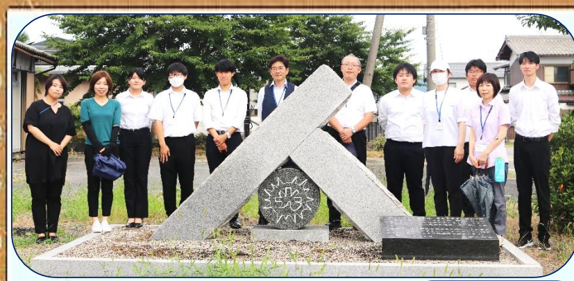
(7/31:豊郷町着任者現地研修会)