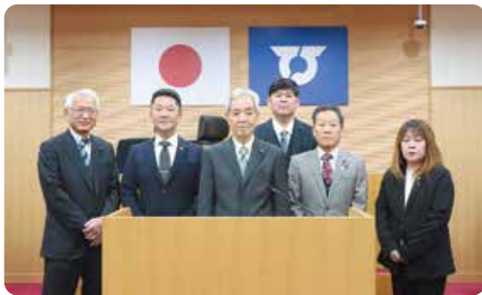
議会広報常任委員会