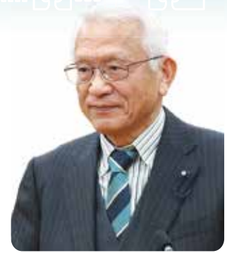
本田 きよはる 議員