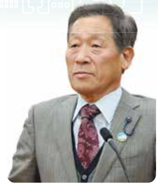
西澤 ひろかず 議員