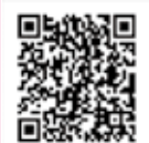
確定申告書 作成コーナー