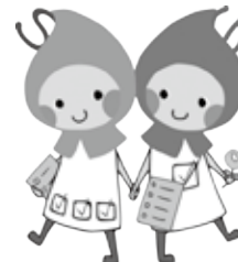
滋賀県健康づくりキャラクター しがのハグ&クミ