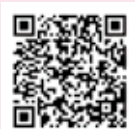
国税庁LINE 公式アカウント

スマホ等からe・Taxを利用すれば、自宅でも申告書の作成・送信ができます！（下項目参照）