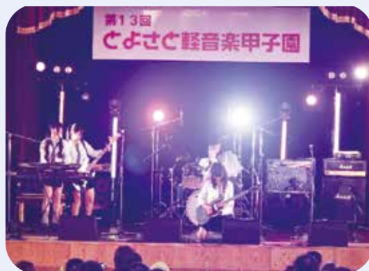
▲滋賀県知事賞を受賞したノンシュガー (滋賀県立大津高等学校)

高校生とは思えないレベルの演奏力とパフォーマンスで来場者を魅了し、会場全体が大いに盛り上がった1日となりました。