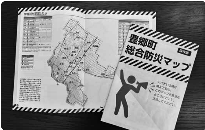
豊郷町総合防災マップ

答 地域防災計画は町の防災計画であり、被災のときの職員の体制や予防、避難、また、実際被災した時の対策、復興、そういった手順をさだ