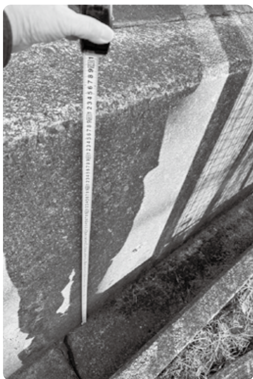
段差が1m30cmなのに防護柵がない

ただきたい。 問 予算がつけられなければ、ふるさと納税で道路安全対策事業に対する寄付金とかいう色づけをできないか。ふるさと納税担当課は。 答 (地域整備課長) 予算がついたからできるとかいうのではなく、中山道では家が張りついたりとかして、できない状況があるというのが一番の原因だと考えております。