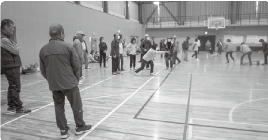
老人クラブのニュースポーツ大会

の補助をどこまでの団体でおこなうか、どうあるべきか、もう少し整理が必要でないか、わかりやすい線引きをしていきたいと考えています。