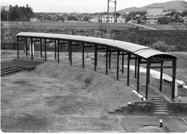
豊栄のさと 太陽光パネル