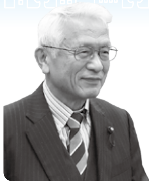
本田 きよはる 議員