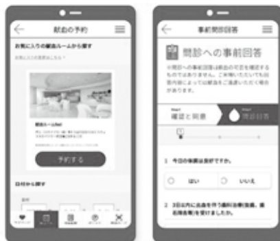
※アプリ画面はイメージです

献血未経験者でも アプリから献血予約が可能！ ※当日予約※(3時間前)もできるので、お近くの献血会場を選択して、手軽に献血できます。 ※献血会場によっては当日予約できない場合があります。