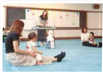
ぞう・うさぎクラス

先生が弾くピアノのリズムに合わせ、おうちの人と一緒に触れ合ったり、体を動かしたりして親子で楽しい時間を過ごしました。